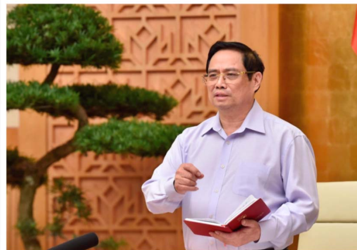
Thủ tướng Phạm Minh Chính nhất biểu kết luận Hội nghị trực tuyến của Chính phủ với các địa phương chiều 2/7.

Baquocte.vn. Kết luận Hội nghị trực tuyến của Chính phủ với các địa phương chiều 2/7, Thủ tướng Phạm Minh Chính chỉ ra 4 bài học, 5 quan điểm chỉ đạo và 11 nhiệm vụ trong thời gian tới mà các địa phương phải tập trung tổ chức triển khai thực hiện có hiệu quả.