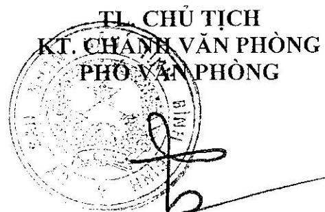
Trần Trọng Triêm