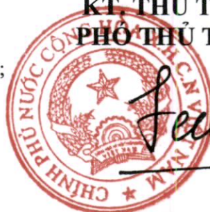
Lê Minh Khái

TM. CHÍNH PHỦ KT, THỦ TƯỚNG PHÓ THỦ TƯỚNG