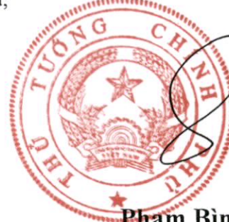
Phạm Bình Minh