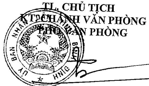
Trần Trọng Triêm