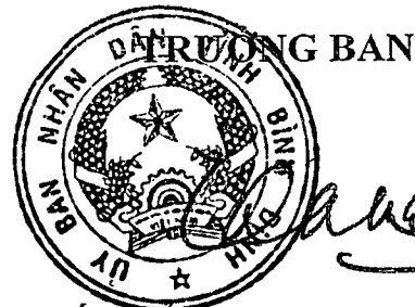
PHÓ CHỦ TỊCH TT UBND TỈNH Phan Cao Thắng