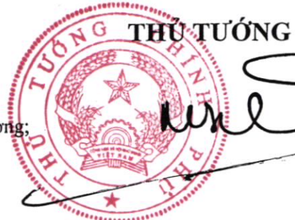
Phạm Minh Chính