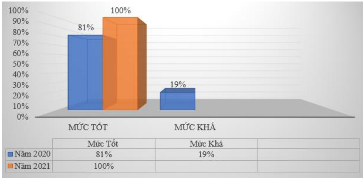
Hình 1. Biểu đồ tỷ lệ đánh giá tổng thể mức độ ứng dụng CNTT của các sở, ban, ngành theo mức Tốt, Khá và Trung bình: