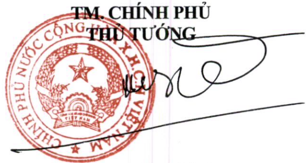
Phạm Minh Chính