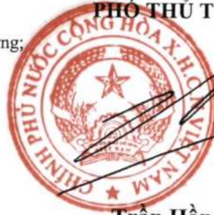
Trần Hồng Hà

TM. CHÍNH PHỦ KT. THỦ TƯỚNG PHÓ THỦ TƯỚNG