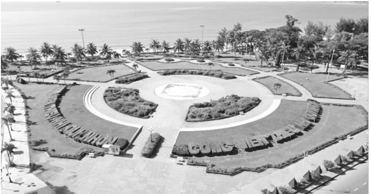
Hiện trạng Công Viên Thiếu Nhi Quy Nhơn (Phần Mở Rộng)

- Một số nhà đầu tư đề xuất sử dụng khu đất này đầu tư một số hạng mục ngầm và bán ngầm, kết nối với khu đất 01 Ngô Mây qua đường An Dương Vương, tuy nhiên ý tưởng trên đang được UBND tỉnh xem xét.