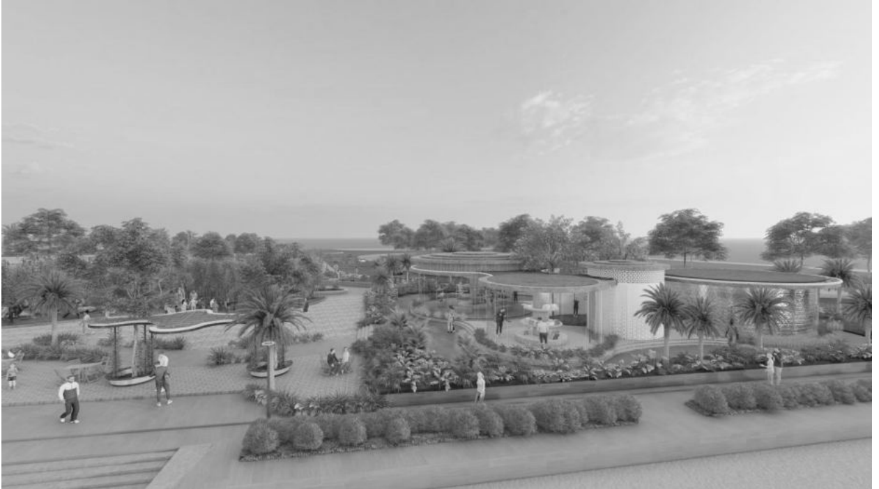
Khu trưng bày (hướng nhìn từ biển vào khu vực công viên)

- Khu trưng bày binh khí, quần áo các môn phái, Sa bàn tổng quan của toàn bộ công viên; khu vực thay đồ, khu vệ sinh. Khu trưng bày cũng là nơi giới thiệu các sản phẩm làm quà lưu niệm như: tượng, phù điêu các thế võ. Bán Áo quần các môn phái võ, bán các loại thuốc Võ gia truyền của các môn phái và đặc biệt: Cho Thuê Đồ Võ, Binh khí để chụp ảnh checkin và in hình ảnh chứng nhận đã đến Công Viên Võ Bình Định.