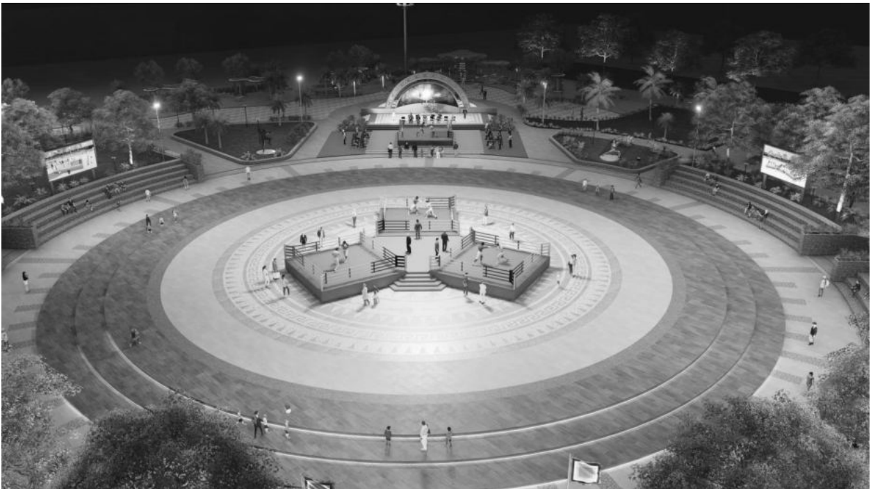
b) Sân khấu tổ chức các chương trình: 250m 2

- Sàn thi đấu có thể bố trí thêm 03 sàn thi đấu tại khu vực giữa vòng tròn trung tâm khi có các sự kiện võ thuật diễn ra cần quy mô thi đấu tập trung.