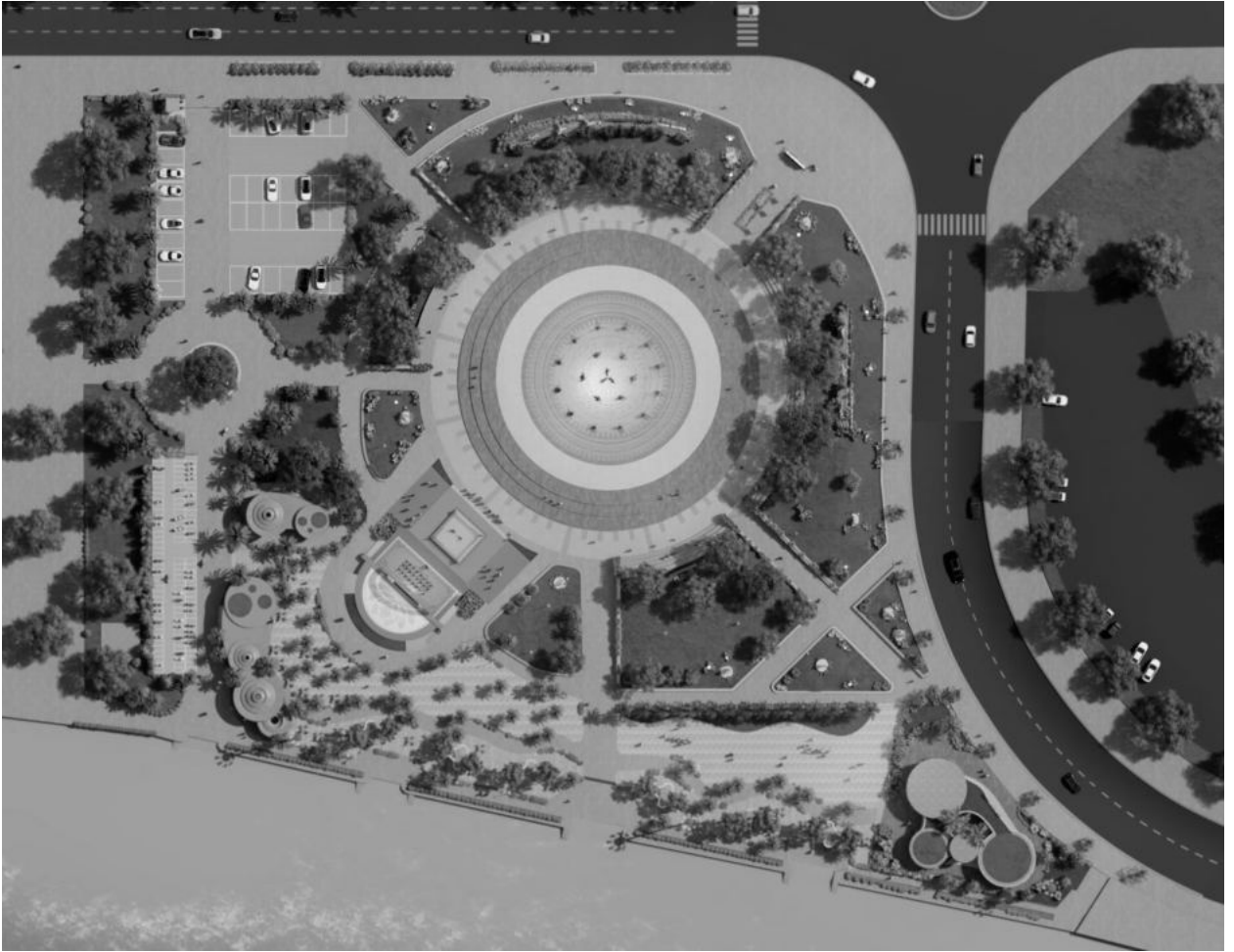
Công viên Võ Bình Định được cải tạo trên nền công viên thiếu nhi (phần mở rộng)