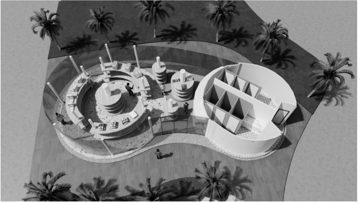
Khu dịch vụ kết hợp nhà vệ sinh công cộng (diện tích 150m 2 )

- Khu dịch vụ được tạo hình mái dạng bình khí hình tám khiên, hướng lối vào bố trí bãi đậu xe 02 bánh nhằm giải quyết nhu giữ xe máy cho toàn bộ khu vực công viên Võ - khu vực bãi xe máy phục vụ người dân tắm biển, tham quan, du khách, các võ sinh tập luyện và biểu diễn tại công viên Võ.