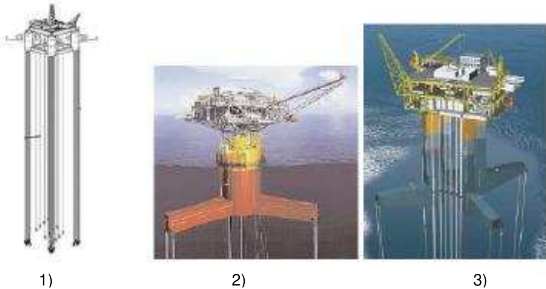
Hình 2 – Các dạng kho chứa nổi kiểu giàn chân căng điển hình

(3) Kho chứa nổi kiểu giàn chân căng dạng đa cột (Moses) là dạng kho chứa nổi kiểu giàn chân căng bao gồm bốn cột bên trong với bốn kết cấu đỡ chân căng, hai chân căng tại mỗi kết cấu đỡ.