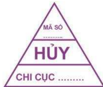
Hình 14: Mẫu dấu hủy đối với gia cầm