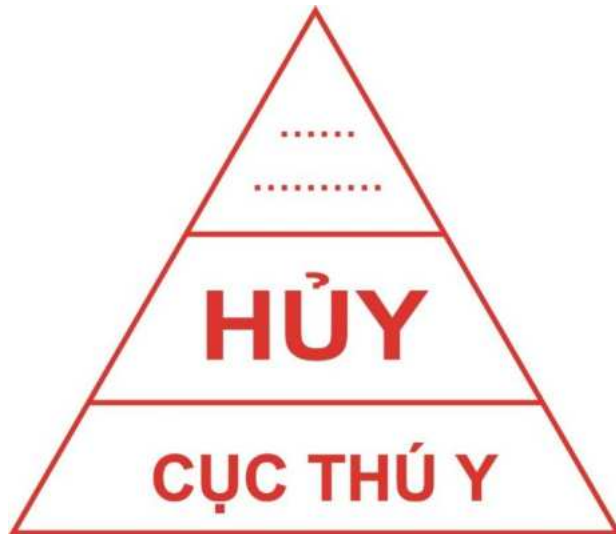
Hình 7: Mẫu dấu hủy đối với gia súc