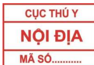
Hình 4. Mẫu dấu kiểm soát giết mổ gia cầm để tiêu thụ nội địa