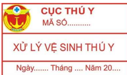
Hình 16: Mẫu tem xử lý vệ sinh thú y