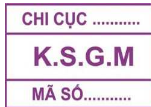
Hình 10: Mẫu dấu kiểm soát giết mổ gia cầm