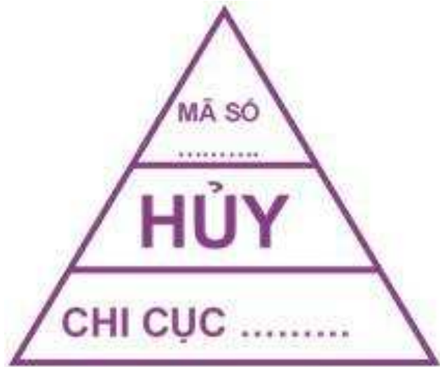
Hình 13: Mẫu dấu hủy đối với gia súc