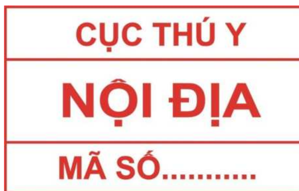
Hình 3. Mẫu dấu kiểm soát giết mổ gia súc để tiêu thụ nội địa