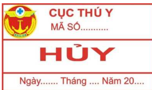
Hình 17: Mẫu tem tiêu hủy