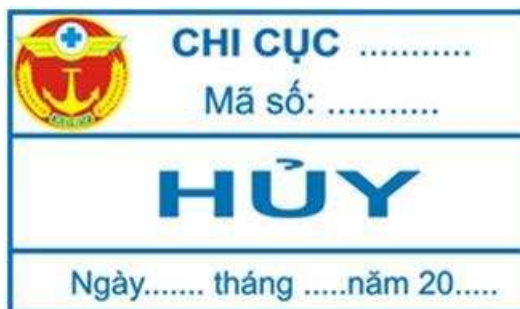
Hình 20: Mẫu tem tiêu hủy