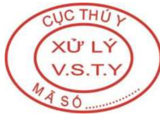
Hình 6. Mẫu dấu xử lý vệ sinh thú y đối với gia cầm