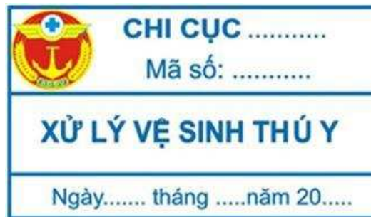
Hình 19: Mẫu tem xử lý vệ sinh thú y