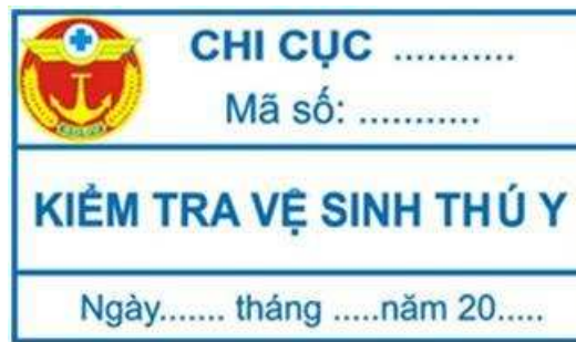
Hình 18: Mẫu tem vệ sinh thú y