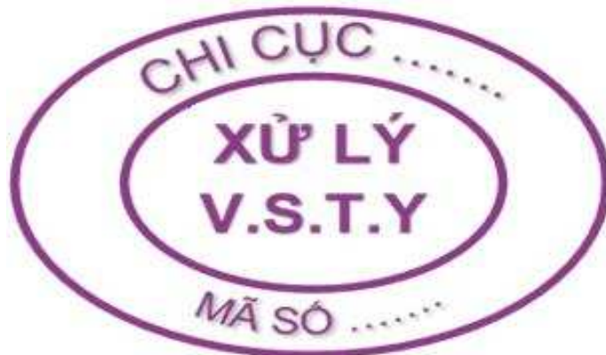
Hình 11: Mẫu dấu xử lý vệ sinh thú y đối với gia súc