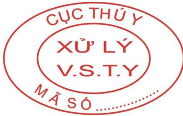
Hình 5: Mẫu dấu xử lý vệ sinh thú y đối với gia súc