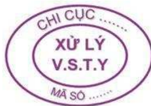
Hình 12: Mẫu dấu xử lý vệ sinh thú y đối với gia cầm