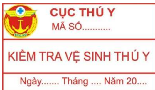
Hình 15: Mẫu tem vệ sinh thú y