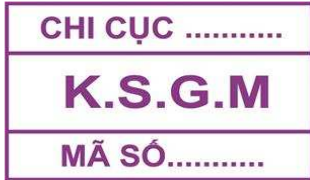
Hình 9: Mẫu dấu kiểm soát giết mổ gia súc