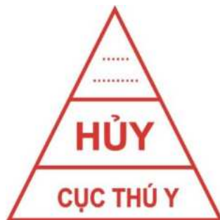
Hình 8. Mẫu dấu hủy đối với gia cầm