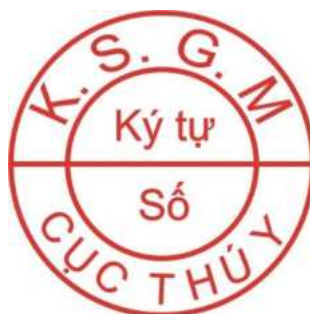
Hình 1. Mẫu dấu kiểm soát giết mổ gia súc để xuất khẩu