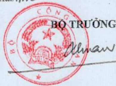
Đại tướng Lương Tam Quang